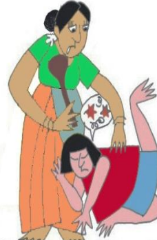
Öfkeyi, gerginliği azaltmak için çocuğu örselemek, itip kakmak