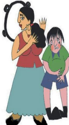
Çocuğun tıbbi gereksinimlerini göz ardı etmek