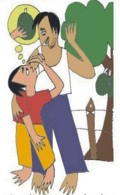
Çocuğu kendi çıkarları için kullanmak