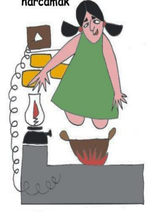
Zarar verecek durumlarda çocuğu denetimsiz bırakmak