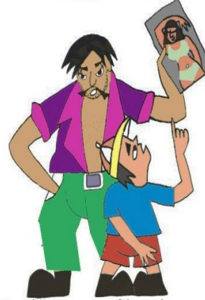
Çocuğu pornografik malzemeye veya davranışlara maruz bırakmak