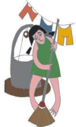
Başka işler yaptırarak çocuğun eğitim ve hobileri için kullanacağı zamanı harcamak