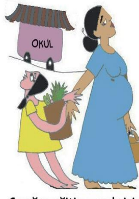
Çocuğun eğitim gereksinimlerini göz ardı etmek