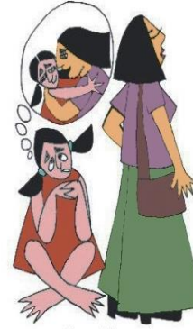
Çocuğun duygusal gereksinimlerini göz ardı etmek