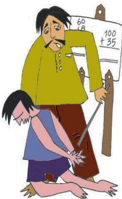
Okulda çocuğa vurmak veya aşğılamak