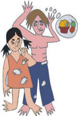
Çocuğa yeterli bakım sağlamamak, ör: Kirli, çıplak, aç bırakmak