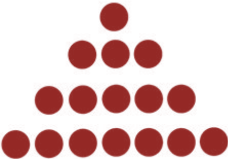
Nim Oyunu Başlangıç Dizilimi